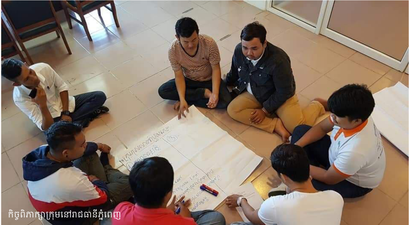
កិច្ចពិភាក្សាក្រុមនៅរាជធានីភ្នំពេញ

ប្រទេសនីមួយៗបានរាយការណ៍ និងផ្តល់អនុសាសន៍ទៅរដ្ឋាភិបាល វិស័យឯកជន និងអង្គការធ្វើលើបញ្ហាអ្នក ស្រឡាញ់ភេទដូចគ្នា។ APCOM និង MRIF រួមជាមួយដៃគូនានានឹងបន្តធ្វើការតស៊ូមតិ ដើម្បីទទួលបានការអនុវត្តនូវ អនុសាសន៍ទាំងអស់នេះ ក្នុងគោលបំណងដើម្បីលុបចោលនូវរចនាសម្ព័ន្ធ និងឧបសគ្គផ្សេងៗទៀតសម្រាប់ការ ដាក់បញ្ចូលផ្នែកសេដ្ឋកិច្ច ក៏ដូចជាផ្នែកសង្គម និងទទួលបានការចូលរួមយ៉ាងពេញលេញសម្រាប់ប្រជាជនអ្នក ស្រឡាញ់ភេទដូចគ្នា (LGBTQI) នៅក្នុងសង្គមកម្ពុជា។